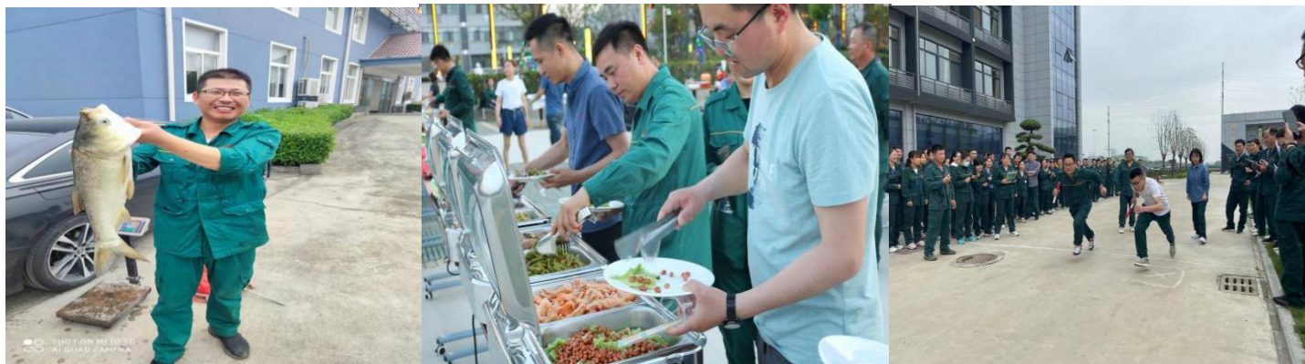
丰富的技能培训提升