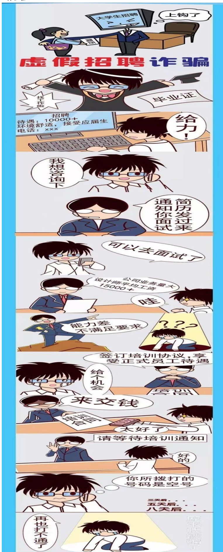
(艺术学院学生创作)